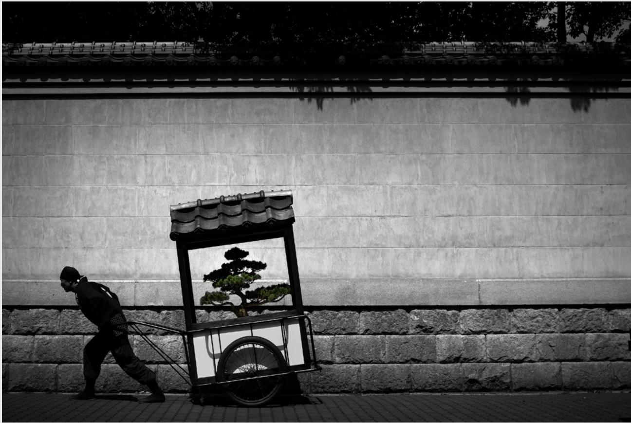
山村幸則《走楽園》 2008年、神戸／日本