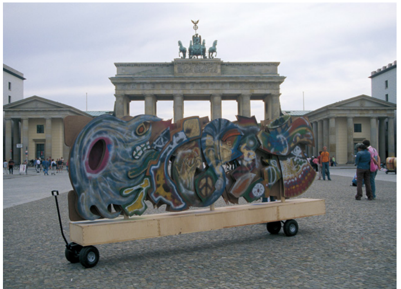
<1段目>山村幸則《旅するイカリ》2017年、神戸/日本、撮影：坂井志奈子 <2段目左>山村幸則《Kiosk ya Chai》2005年、ナイロビ/ケニア、撮影：Morris Keyonzo <2段目右>山村幸則《たこやきや》2009年、神戸/日本、撮影：大野博 <3段目>山村幸則《Berlin Graffiti Walk》2005年、ベルリン/ドイツ、撮影：山村幸則